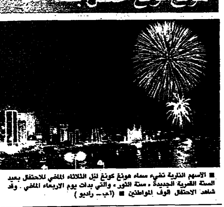
هونغ كونغ تحتفل بسلامة

ريغان يعين سبرينكل رئيسا للمستشارين الاقتصاديين لدى الرئاسة اعان رسميا في فيينا ان كارل سوكاتينا وزير التعمير النمسوي قدم استقالة صباح اسس. وكان سوكاتينا قد قدم استقالته منذ بضعة ايام من منصبه كرئيس لثقافة العاصم. وكانت الصحف والدوائر الثقلية قد اتهمت هذا الوزير منذ عدة ايام بأنه استغل اموال الثقافة في اغراض شخصية. وكانت الدوائر الثقلية قد وجهت الانتقاد مرارا الى هذا الوزير لعدم وعظافته. فقد كان سوكاتينا وزيراً ورئيساً لثقافة ورياسة اتحاد كرة القدم النمسوي لمدة سنوات. فيينا - الح.ب.